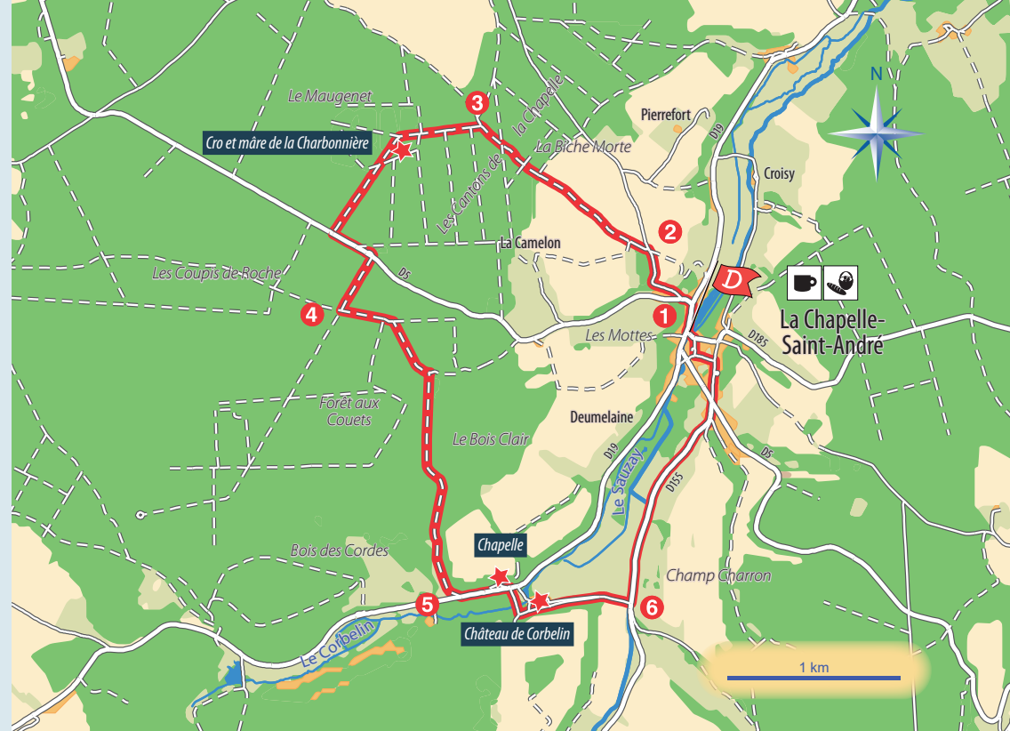
Chapelle de Corbelin

Profitez aussi de visiter l'église, d'apprécier le Sauzay cette rivière jalonnée de magnifiques moulins. Dans les bois, le lieu dit «Cro et mâre de la Charbonnière» perpétuent le souvenir des Charbonniers qui fabriquaient du charbon de bois servant à alimenter le haut fourneau des Corbelins.