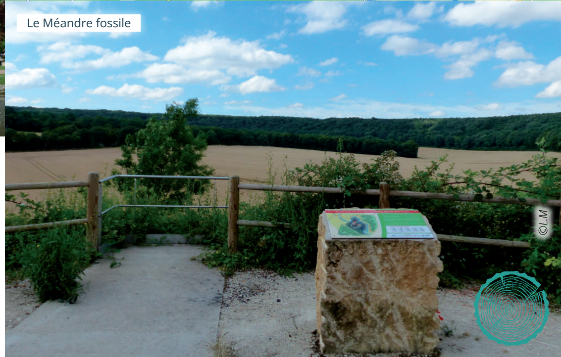
Le Méandre fossile