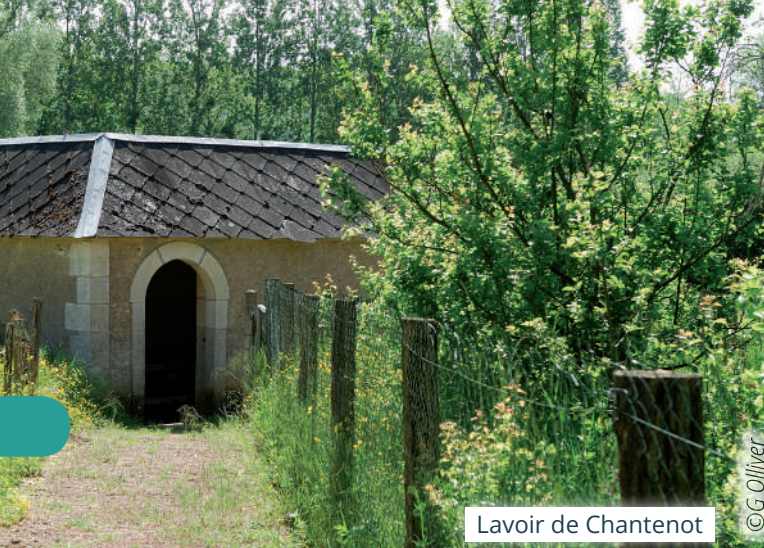
Lavoir de Chantenot