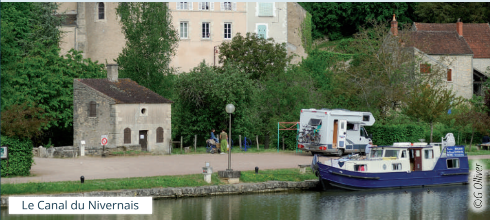
Le Canal du Nivernais